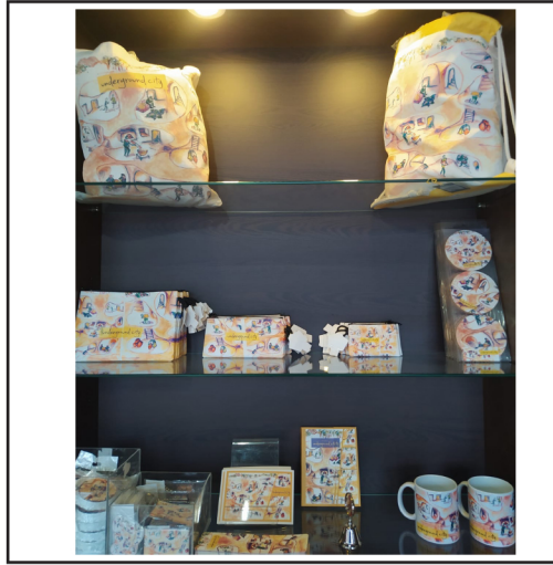
Büşra Gizem Vayvay, Yeraltı Koleksiyonu, 2018